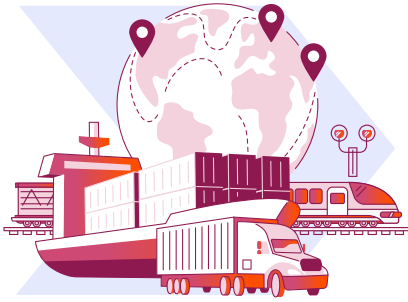
Denizler ve iç sular, kara yolları ve demir yollarında faaliyet gösteren nakliye şirketleri